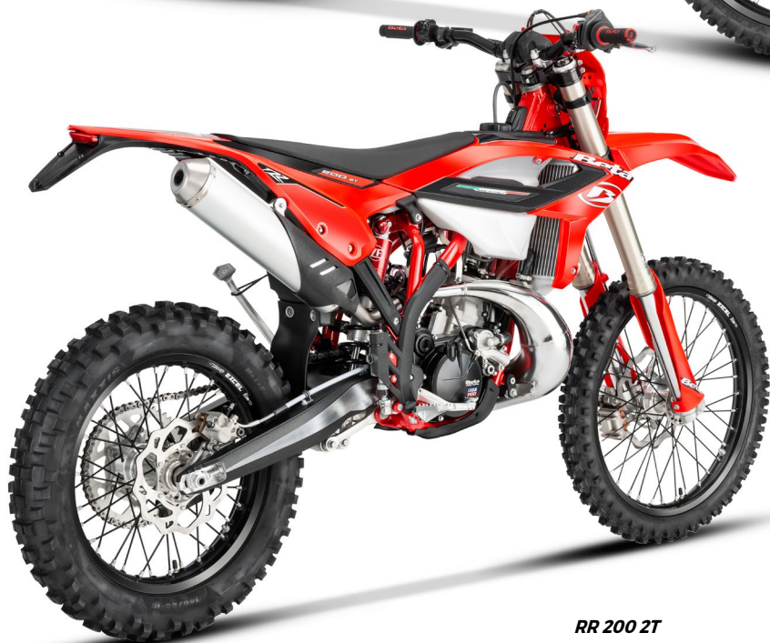
RR 200 2T

Nuovi convogliatori della gamma RR. Più stretti, più ergonomici, e più filanti, per un look rinnovato, semplice ed essenziale. / New radiator shrouds on the RR range. Narrower than before, more ergonomically shaped. The sleeker new shrouds also contribute to the revised, simple, and essential new look of the bike. / Nouvelles ouïes de la gamme RR. Plus étroites, plus ergonomiques, plus aérodynamiques, pour un nouveau look, simple et essentiel. / Neue Tankspoiler der Baureihe RR. Sie sind schmaeler, ergonomischer und stromlinienförmiger, fuer einen neueren, einfacheren und essentielleren Look.