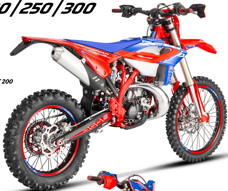
RR RACING 2T 200

2Str: Compared to the RR models, the cylinder of the 300 cc engine now features modified exhaust and transfer port geometry and a different cylinder head, combined with a differently calibrated power valve. The cylinder head, different from standard both in terms of modified flow geometry and combustion chamber geometry, ensures a higher compression ratio, resulting in a substantial increase in performance. / RR 300 2T : le bloc-moteur de 300 cm 3 comporte un cylindre avec des transferts modifiés, ainsi qu'une culasse différente, associée à un réglage différent des valves d'échappement, par rapport aux modèles RR. La culasse elle aussi, modifiée par rapport au modèle standard, tant au niveau de son alignement par rapport aux schémas que de sa forme dans la chambre de combustion, assure une augmentation du rapport de compression et des performances nettement différentes au modèle standard. / RR 300 2T: Der Motorblock des 300 cm 3 -Motors hat einen Zylinder mit veränderten Steuerdiagrammen für die Auslass- und Überströmerzeiten und einen neuen Zylinderkopf in Kombination mit einer anderen Einstellung des Auslassventils als bei den RR-Modellen. Der Zylinderkopf, der sich von der Standardausführung sowohl in Sachen Anpassung an die Steuerdiagramme als auch in Bezug auf die im Brennraum rekonstruierte Form unterscheidet, gewährleistet eine Steigerung des Verdichtungsverhältnisses und eine deutlich bessere Leistung.