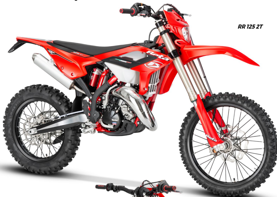
RR 125 2T

Nuovi convogliatori della gamma RR. Più stretti, più ergonomici, e più filanti, per un look rinnovato, semplice ed essenziale. / New radiator shrouds on the RR range. Narrower than before, more ergonomically shaped. The sleeker new shrouds also contribute to the revised, simple, and essential new look of the bike. / Nouvelles ouïes de la gamme RR. Plus étroites, plus ergonomiques, plus aérodynamiques, pour un nouveau look, simple et essentiel. / Neue Tankspoiler der Baureihe RR. Sie sind schmaeler, ergonomischer und stromlinienförmiger, fuer einen neueren, einfacheren und essentielleren Look.