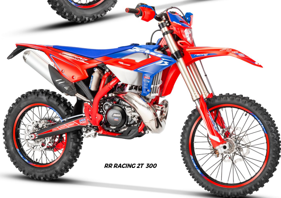
RR RACING 2T 300

RR 200 2T: anche il motore 200cc mantiene una testa cilindro diversa rispetto alla versione standard e, insieme a questa, una singola molla più sostenuta della valvola di scarico, al posto delle due utilizzate per RR. Tutto questo allo scopo di avere una maggior potenza ai regimi medio-alti. / RR 200 2Str: The 200 cc engine also retains a different cylinder head to the standard version, as well as a single, stiffer power valve, instead of the two used in the RR. All this contributes to increasing power at mid to high engine speeds. / RR 200 2T : le moteur de 200 cm 3 reçoit également une culasse différente de celle de la version standard et, par conséquent, un seul ressort de valve d'échappement taré plus fort, au lieu des deux utilisés pour la RR. L'objectif de tout cela est d'obtenir plus de puissance dans la plage des mi et haut régimes. / RR 200 2T: Auch der 200 cm 3 -Motor hat einen anderen Zylinderkopf als die Standardversion und außerdem eine stärkere Feder des Auslassventils, anstelle der zwei verwendeten für RR. All dies mit dem Ziel, eine höhere Leistung im mittleren und hohen Drehzahlbereich zu erhalten.